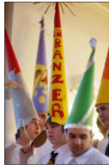
Spexare | Stjärngossarnas mössor visade prov på kreativitet och fantasi.