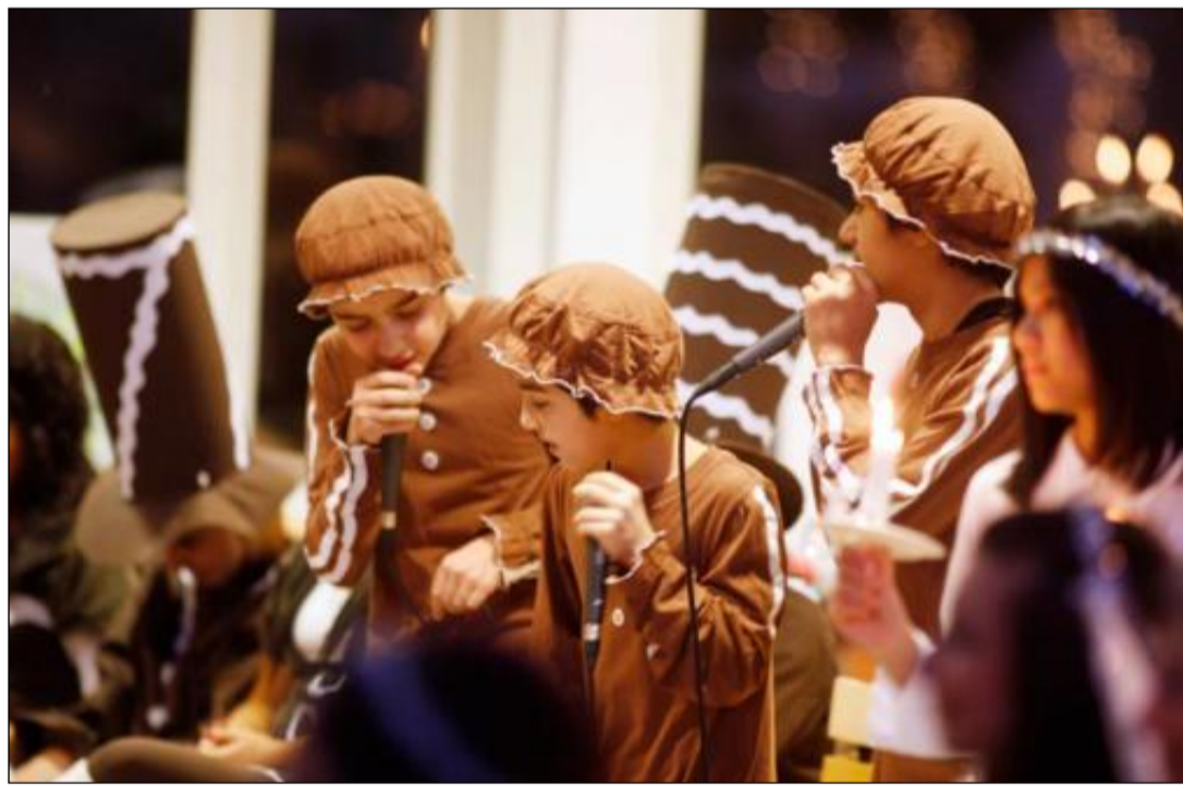
Succé | De rappande pepparkaksgubbarna drog ned skratt och applåder.

Men de rappande pepparkaksgubbarna glömmar ingen. Ald-