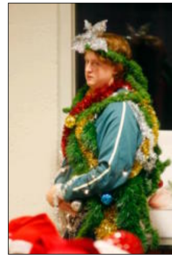
Inga barr | Levande julgranar barrar inte...

Eskilstuna-Kuriren GRUNDAD 1890 | © 2008